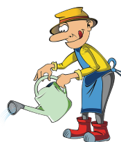
De planten water geven