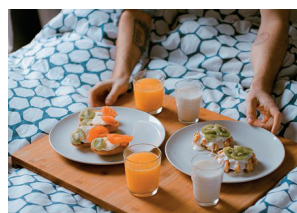
Ontbijt op bed serveren