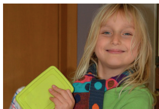
De afwas doen