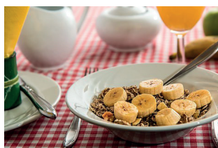
De tafel dekken en afruimen