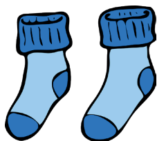
Sokken sorteren en oprollen