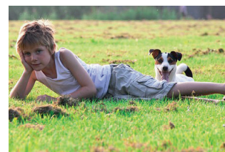
De hond uitlaten