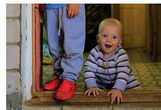
Oppassen op je broertje of zusje